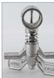
En option : frein de parking